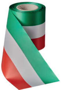
Art.: 00019 Farbe: 918 grün/weiß/rot