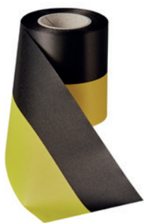
Art.: 00019 Farbe: 911 schwarz/gelb