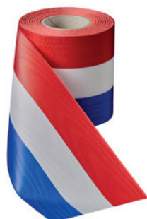
Art.: 00021 Farbe: 915 rot/weiß/ dunkelblau