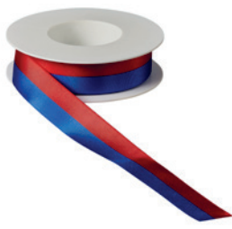
Art.: 00500 Farbe: 930 blau-rot