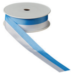
Art.: 00500 Farbe: 923 mittelblau/ weiß