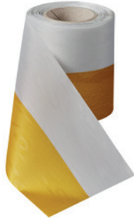
Art.: 00021 Farbe: 993 gelbgold/weiß