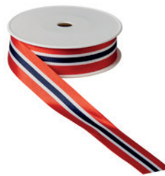
Art.: 00500 Farbe: 921 Norwegen