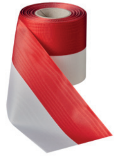
Art.: 00021 Farbe: 991 rot/weiß