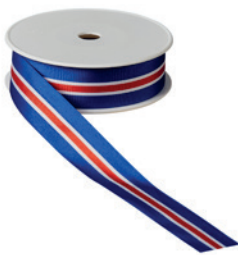
Art.: 00500 Farbe: 924 Island