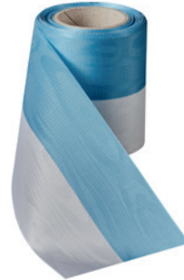
Art.: 00021 Farbe: 994 hellblau/weiß