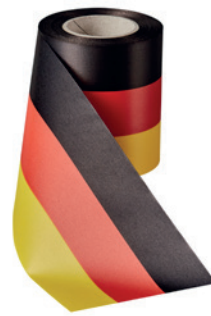
Art.: 00019 Farbe: 917 schwarz/rot/ gold