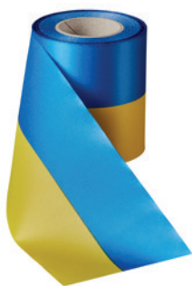
Art.: 00019 Farbe: 910 mittelblau/ gelb

Breiten: 75 – 200 mm (nicht alle Farben in allen Breiten erhältlich)