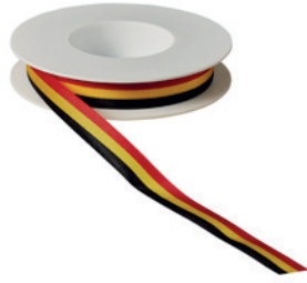
Art.: 00500 Farbe: 919 schwarz/ gelb/rot