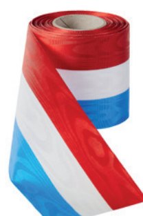
Art.: 00021 Farbe: 914 rot/weiß/ hellblau