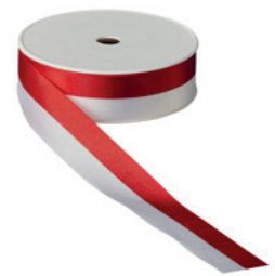
Art.: 00500 Farbe: 991 rot/weiß