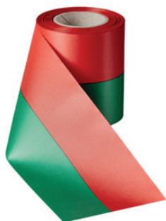
Art.: 00019 Farbe: 931 grün-rot