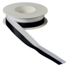
Art.: 00500 Farbe: 997 schwarz/weiß