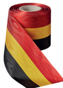
Art.: 00021 Farbe: 919 schwarz/ gelb/rot