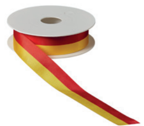
Art.: 00500 Farbe: 998 rot/gelbgold