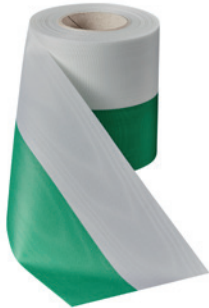
Art.: 00021 Farbe: 992 grün/weiß