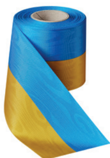
Art.: 00021 Farbe: 910 mittelblau/gelb

Breiten: 50 – 225 mm (nicht alle Farben in allen Breiten erhältlich)