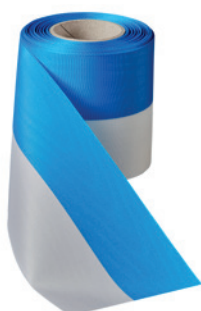
Art.: 00021 Farbe: 923 mittelblau/ weiß