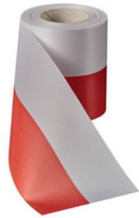
Art.: 00019 Farbe: 991 rot/weiß