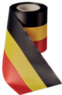
Art.: 00019 Farbe: 919 schwarz/ gelb/rot