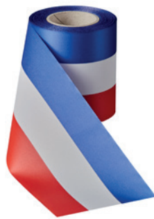
Art.: 00019 Farbe: 915 rot/weiß/ dunkelblau