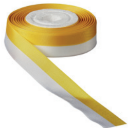
Art.: 00500 Farbe: 993 gelbgold/weiß