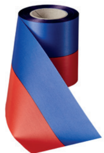
Art.: 00019 Farbe: 930 blau-rot