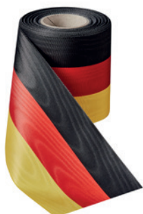
Art.: 00021 Farbe: 917 schwarz/rot/ gold