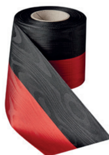
Art.: 00021 Farbe: 912 schwarz/rot