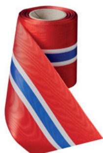
Art.: 00021 Farbe: 921 Norwegen