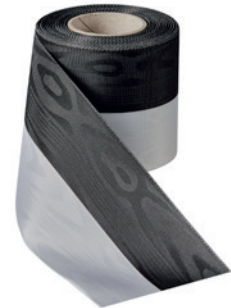
Art.: 00021 Farbe: 997 schwarz/weiß