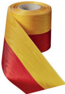
Art.: 00021 Farbe: 998 rot/gelbgold