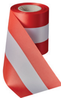
Art.: 00019 Farbe: 944 rot/weiß/rot