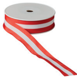
Art.: 00500 Farbe: 944 rot/weiß/rot