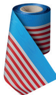
Art.: 00021 Farbe: 928 USA