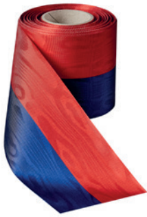
Art.: 00021 Farbe: 930 blau-rot