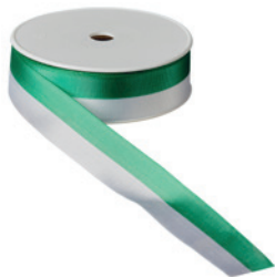
Art.: 00500 Farbe: 992 grün/weiß