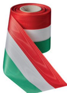
Art.: 00021 Farbe: 918 grün/weiß/rot