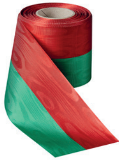
Art.: 00021 Farbe: 931 grün-rot