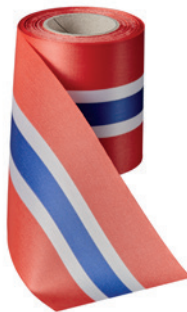
Art.: 00019 Farbe: 921 Norwegen