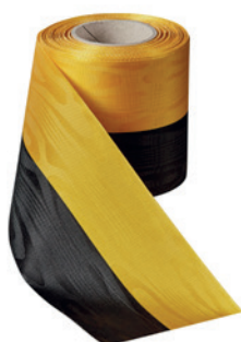
Art.: 00021 Farbe: 911 schwarz/gelb