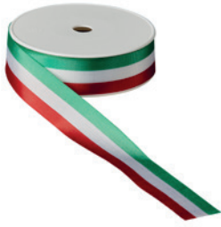
Art.: 00500 Farbe: 918 grün/weiß/rot