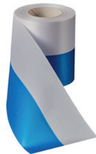
Art.: 00019 Farbe: 923 mittelblau/ weiß