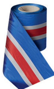
Art.: 00021 Farbe: 924 Island