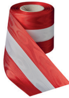
Art.: 00021 Farbe: 944 rot/weiß/rot