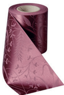
Art.-Nr.: 06990 Farbe: 019 kardinalrot