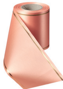
Art.-Nr.: 06508 Farbe: 081 apricot