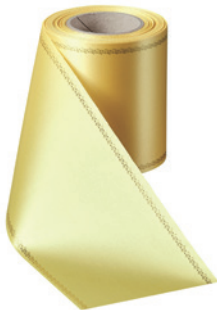
Art.-Nr.: 06078 Farbe: 017 mais