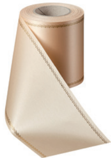
Art.-Nr.: 06078 Farbe: 075 beige