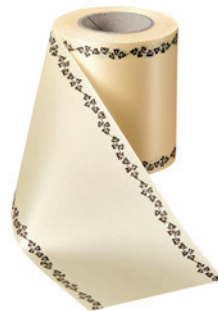
Art.-Nr.: 06739 Farbe: 015 sekt