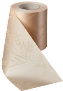
Art.-Nr.: 06890 Farbe: 075 beige