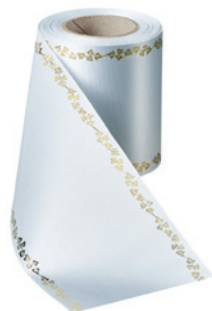
Art.-Nr.: 06738 Farbe: 022 hellgrau