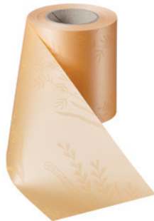
Art.-Nr.: 06890 Farbe: 073 pfirsich