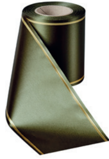
Art.-Nr.: 06508 Farbe: 029 moosgrün