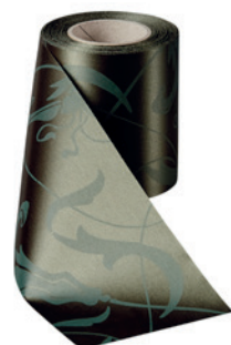
Art.-Nr.: 06860 Farbe: 029 moosgrün