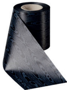
Art.-Nr.: 06970 Farbe: 031 schwarz