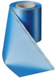
Art.-Nr.: 06078 Farbe: 054 kobaltblau