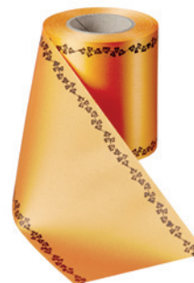
Art.-Nr.: 06739 Farbe: 086 terrakotta