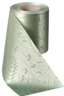
Art.-Nr.: 06990 Farbe: 079 hellgrün