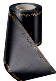
Art.-Nr.: 06738 Farbe: 031 schwarz