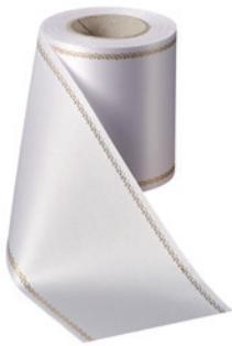
Art.-Nr.: 06078 Farbe: 001 weiß