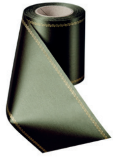
Art.-Nr.: 06078 Farbe: 029 moosgrün