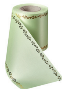
Art.-Nr.: 06738 Farbe: 070 limonengrün