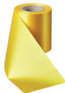
Art.-Nr.: 06000 Farbe: 057 gelb