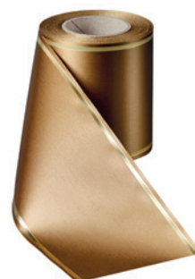
Art.-Nr.: 06508 Farbe: 064 braun