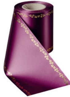
Art.-Nr.: 06738 Farbe: 061 erika brillant