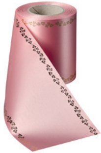
Art.-Nr.: 06738 Farbe: 097 wildrose