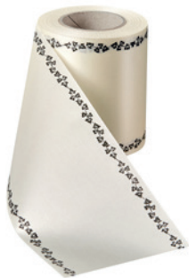
Art.-Nr.: 06739 Farbe: 003 natur