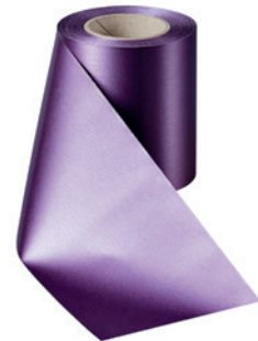
Art.-Nr.: 06000 Farbe: 037 pflaume