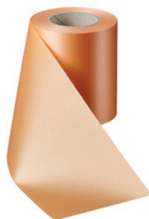
Art.-Nr.: 06000 Farbe: 073 pfirsich