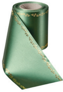
Art.-Nr.: 06738 Farbe: 020 grasgrün