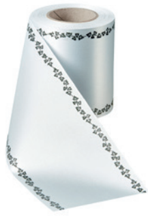
Art.-Nr.: 06739 Farbe: 022 hellgrau

Super-Satin Kranzband besticht mit einer besonders weichen, gleichmäßigen und glatten Oberfläche, die seidig glänzt. Es eignet sich hervorragend für den Thermotransferdruck. Das Band ist außerdem wasserfest und umweltfreundlich, da es ein leicht verrottbares Zellulose Holzprodukt ist.