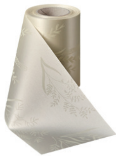
Art.-Nr.: 06890 Farbe: 003 natur