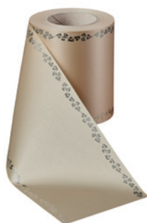
Art.-Nr.: 06737 Farbe: 075 beige