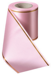
Art.-Nr.: 06508 Farbe: 094 rosa