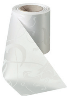
Art.-Nr.: 06860 Farbe: 001 weiß