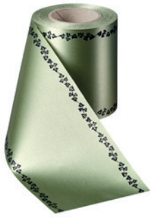
Art.-Nr.: 06739 Farbe: 079 hellgrün