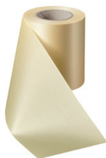
Art.-Nr.: 06000 Farbe: 015 sekt