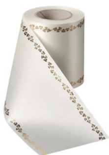
Art.-Nr.: 06738 Farbe: 003 natur