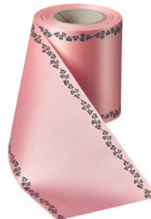
Art.-Nr.: 06739 Farbe: 097 wildrose