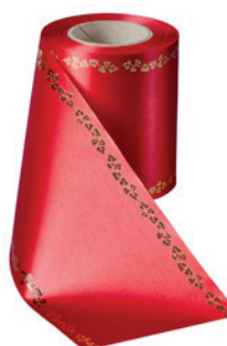
Art.-Nr.: 06738 Farbe: 026 rot