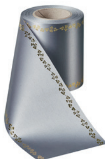
Art.-Nr.: 06738 Farbe: 023 anthrazit