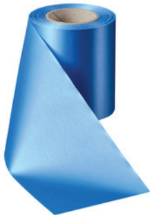
Art.-Nr.: 06000 Farbe: 054 kobaltblau