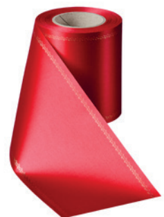
Art.-Nr.: 06078 Farbe: 026 rot