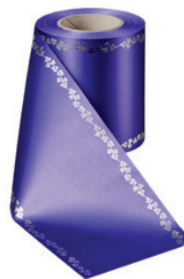
Art.-Nr.: 06737 Farbe: 085 lila