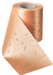
Art.-Nr.: 06990 Farbe: 073 pfirsich