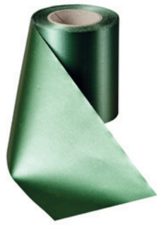
Art.-Nr.: 06000 Farbe: 020 grasgrün