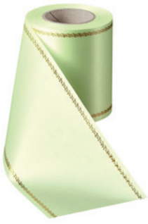
Art.-Nr.: 06078 Farbe: 070 limonengrün