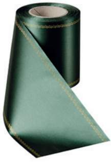
Art.-Nr.: 06078 Farbe: 027 flaschengrün