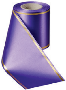
Art.-Nr.: 06508 Farbe: 085 lila