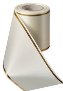
Art.-Nr.: 06508 Farbe: 003 natur