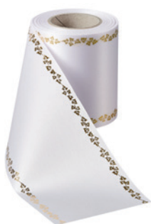
Art.-Nr.: 06738 Farbe: 001 weiß