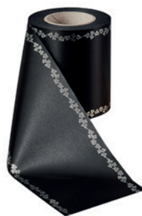
Art.-Nr.: 06737 Farbe: 031 schwarz