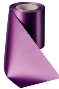
Art.-Nr.: 06000 Farbe: 061 erika brillant