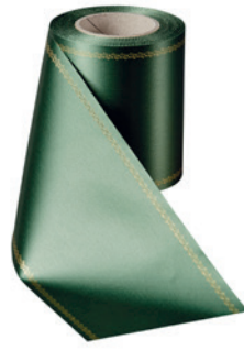
Art.-Nr.: 06078 Farbe: 020 grasgrün