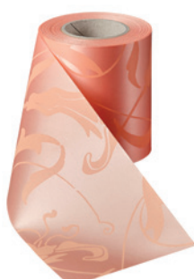
Art.-Nr.: 06860 Farbe: 081 apricot