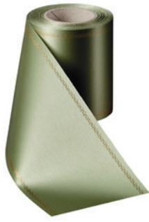
Art.-Nr.: 06078 Farbe: 079 hellgrün