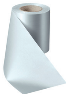
Art.-Nr.: 06000 Farbe: 022 hellgrau