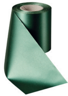
Art.-Nr.: 06000 Farbe: 027 flaschengrün