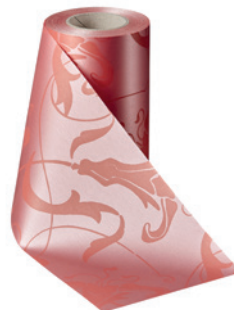
Art.-Nr.: 06860 Farbe: 097 wildrose