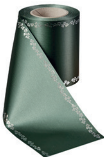
Art.-Nr.: 06737 Farbe: 027 flaschengrün