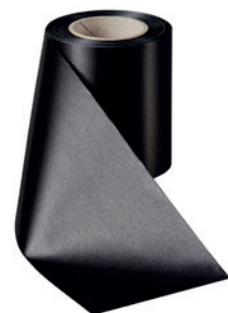
Art.-Nr.: 06000 Farbe: 031 schwarz