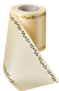
Art.-Nr.: 06738 Farbe: 015 sekt