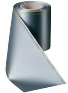
Art.-Nr.: 06078 Farbe: 023 anthrazit