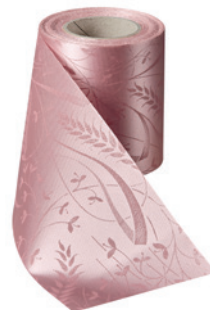
Art.-Nr.: 06990 Farbe: 097 wildrose