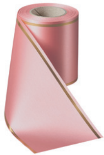
Art.-Nr.: 06508 Farbe: 097 wildrose