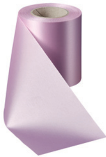
Art.-Nr.: 06000 Farbe: 094 rosa