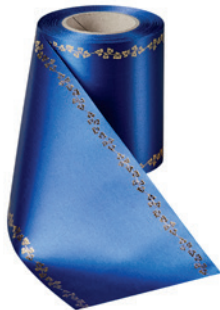
Art.-Nr.: 06738 Farbe: 025 enzyanblau