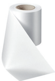
Art.-Nr.: 06000 Farbe: 001 weiß