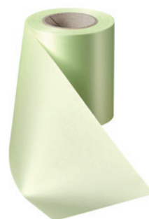
Art.-Nr.: 06000 Farbe: 070 limonengrün