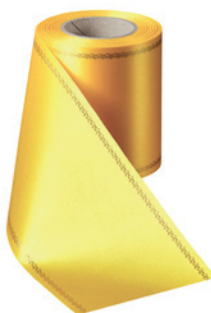
Art.-Nr.: 06078 Farbe: 057 gelb