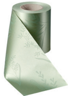
Art.-Nr.: 06890 Farbe: 079 hellgrün