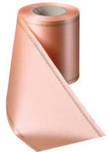
Art.-Nr.: 06078 Farbe: 081 apricot