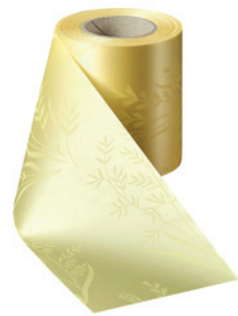
Art.-Nr.: 06890 Farbe: 017 mais