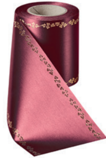
Art.-Nr.: 06738 Farbe: 019 kardinalrot