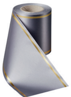
Art.-Nr.: 06508 Farbe: 023 antrazit