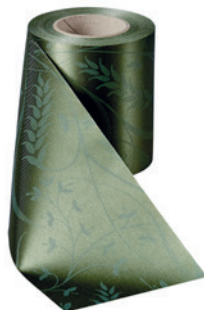
Art.-Nr.: 06990 Farbe: 029 moosgrün