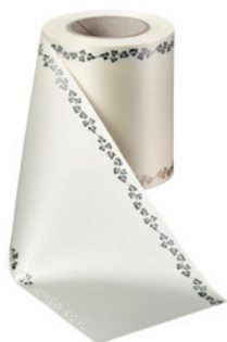
Art.-Nr.: 06737 Farbe: 003 natur