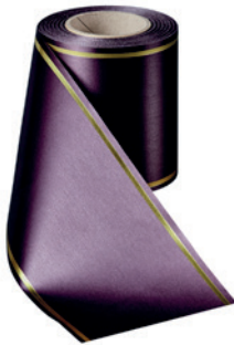
Art.-Nr.: 06508 Farbe: 037 pflaume