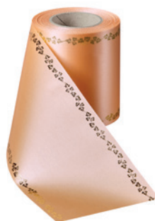
Art.-Nr.: 06738 Farbe: 073 pfirsich