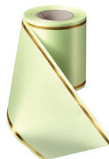
Art.-Nr.: 06508 Farbe: 070 limonengrün