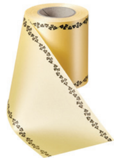
Art.-Nr.: 06739 Farbe: 017 mais