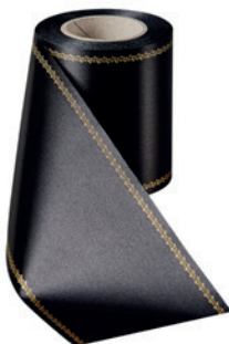
Art.-Nr.: 06078 Farbe: 031 schwarz