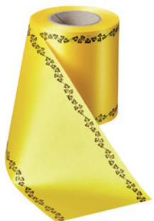
Art.-Nr.: 06739 Farbe: 057 gelb