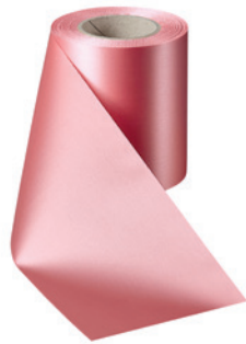
Art.-Nr.: 06000 Farbe: 097 wildrose