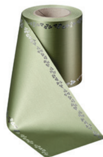
Art.-Nr.: 06737 Farbe: 079 hellgrün