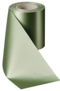
Art.-Nr.: 06000 Farbe: 079 hellgrün