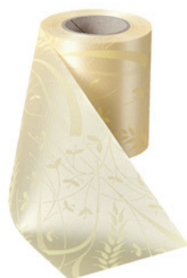
Art.-Nr.: 06990 Farbe: 015 sekt