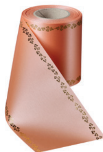
Art.-Nr.: 06738 Farbe: 081 apricot