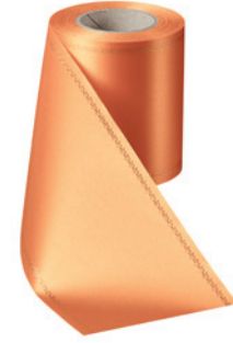
Art.-Nr.: 06078 Farbe: 086 terrakotta