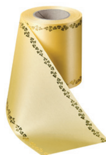
Art.-Nr.: 06738 Farbe: 017 mais