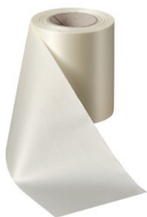
Art.-Nr.: 06000 Farbe: 003 natur