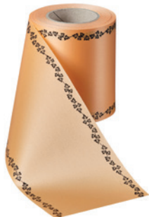
Art.-Nr.: 06739 Farbe: 073 pfirsich