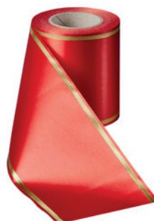
Art.-Nr.: 06508 Farbe: 026 rot