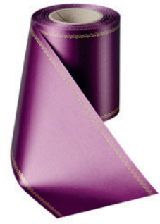
Art.-Nr.: 06078 Farbe: 061 erika brillant