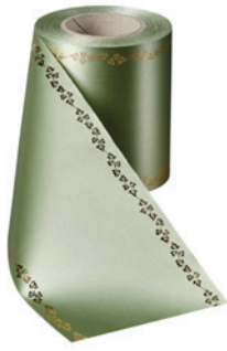
Art.-Nr.: 06738 Farbe: 079 hellgrün