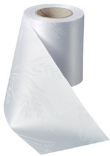
Art.-Nr.: 06890 Farbe: 001 weiß