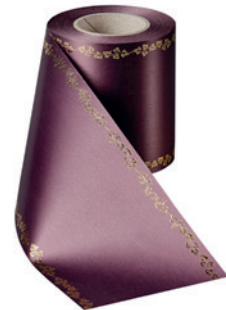
Art.-Nr.: 06738 Farbe: 037 pflaume