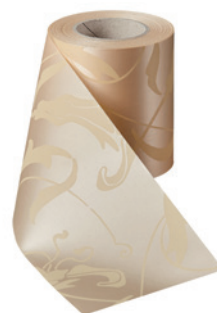
Art.-Nr.: 06860 Farbe: 075 beige