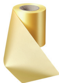
Art.-Nr.: 06000 Farbe: 017 mais