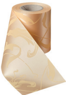
Art.-Nr.: 06860 Farbe: 073 pfirsich