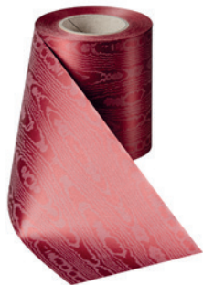
Art.-Nr.: 06970 Farbe: 019 kardinalrot