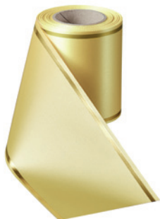
Art.-Nr.: 06508 Farbe: 017 mais