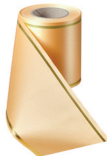
Art.-Nr.: 06508 Farbe: 073 pfirsich