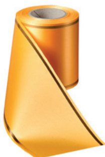
Art.-Nr.: 06508 Farbe: 053 fresia