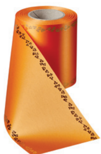
Art.-Nr.: 06738 Farbe: 086 terrakotta