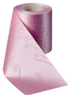
Art.-Nr.: 06890 Farbe: 097 wildrose