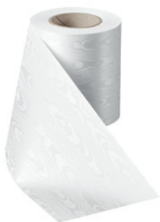
Art.-Nr.: 06970 Farbe: 001 weiß