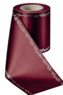
Art.-Nr.: 06737 Farbe: 019 kardinalrot