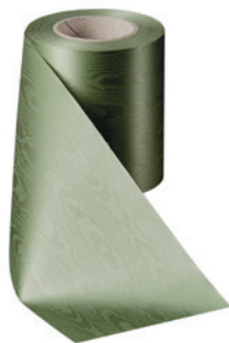
Art.-Nr.: 06970 Farbe: 079 hellgrün