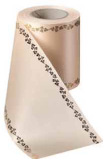
Art.-Nr.: 06738 Farbe: 075 beige