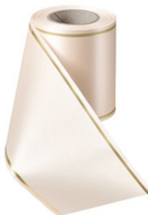
Art.-Nr.: 06508 Farbe: 075 beige