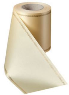
Art.-Nr.: 06078 Farbe: 015 sekt