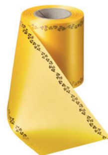
Art.-Nr.: 06738 Farbe: 057 gelb