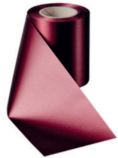
Art.-Nr.: 06000 Farbe: 019 kardinalrot