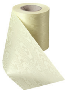
Art.-Nr.: 06970 Farbe: 015 sekt