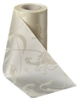
Art.-Nr.: 06860 Farbe: 003 natur