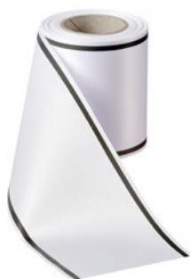
Art.-Nr.: 06509 Farbe: 001 weiß