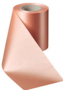
Art.-Nr.: 06000 Farbe: 081 apricot