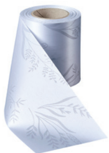
Art.-Nr.: 06890 Farbe: 022 hellgrau