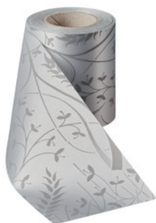
Art.-Nr.: 06990 Farbe: 022 hellgrau