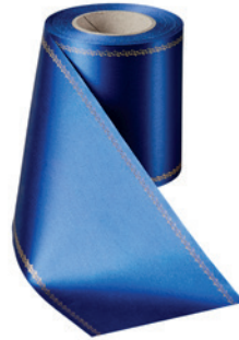
Art.-Nr.: 06078 Farbe: 025 enzianblau