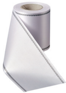
Art.-Nr.: 06079 Farbe: 001 weiß