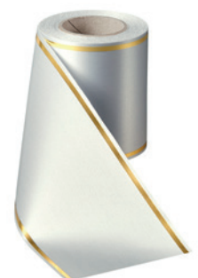
Art.-Nr.: 06508 Farbe: 022 hellgrau