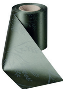
Art.-Nr.: 06890 Farbe: 029 moosgrün