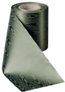
Art.-Nr.: 06970 Farbe: 029 moosgrün