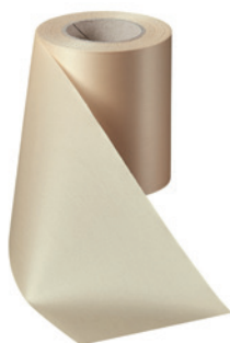
Art.-Nr.: 06000 Farbe: 075 beige