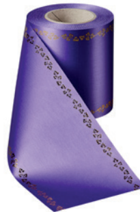
Art.-Nr.: 06738 Farbe: 085 lila