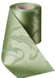
Art.-Nr.: 06860 Farbe: 079 hellgrün