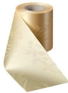
Art.-Nr.: 06890 Farbe: 015 sekt