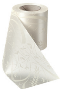
Art.-Nr.: 06990 Farbe: 003 natur