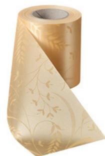
Art.-Nr.: 06990 Farbe: 075 beige