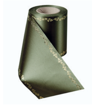
Art.-Nr.: 06738 Farbe: 029 moosgrün