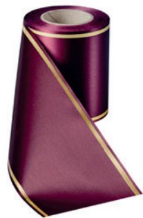
Art.-Nr.: 06508 Farbe: 019 kardinalrot