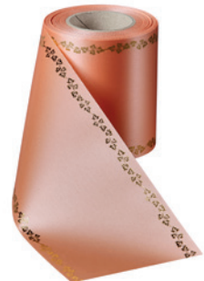
Art.-Nr.: 06739 Farbe: 081 apicot