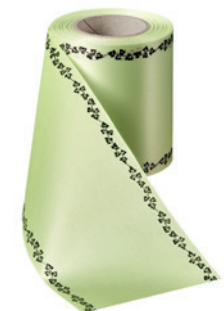
Art.-Nr.: 06739 Farbe: 070 limonengrün