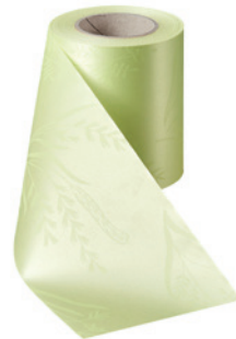
Art.-Nr.: 06890 Farbe: 070 limonengrün