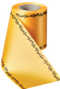
Art.-Nr.: 06739 Farbe: 053 freesia