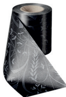
Art.-Nr.: 06990 Farbe: 031 schwarz