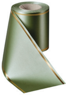
Art.-Nr.: 06508 Farbe: 079 hellgrün