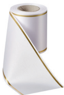
Art.-Nr.: 06508 Farbe: 001 weiß