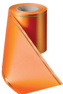
Art.-Nr.: 06508 Farbe: 086 terracotta