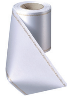
Art.-Nr.: 06078 Farbe: 022 hellgrau