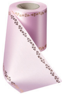
Art.-Nr.: 06738 Farbe: 094 rosa