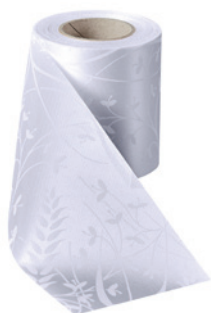
Art.-Nr.: 06990 Farbe: 001 weiß