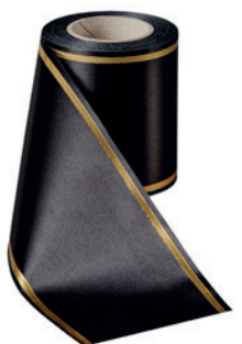
Art.-Nr.: 06508 Farbe: 031 schwarz