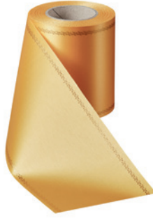
Art.-Nr.: 06078 Farbe: 053 freesia