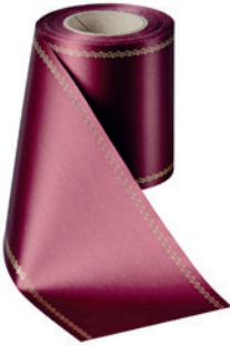
Art.-Nr.: 06078 Farbe: 019 kardinalrot