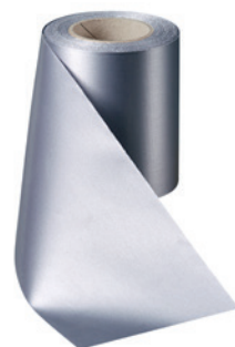
Art.-Nr.: 06000 Farbe: 023 anthrazit