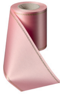
Art.-Nr.: 06078 Farbe: 097 wildrose