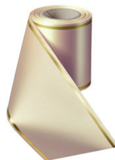
Art.-Nr.: 06508 Farbe: 015 sekt