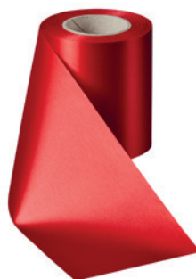
Art.-Nr.: 06000 Farbe: 026 rot