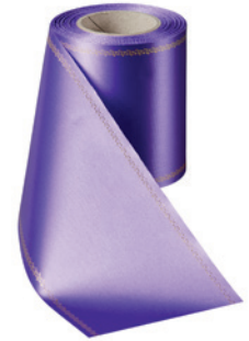
Art.-Nr.: 06078 Farbe: 085 lila