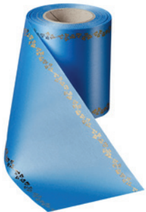
Art.-Nr.: 06738 Farbe: 054 kobaltblau