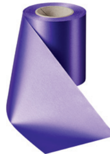
Art.-Nr.: 06000 Farbe: 085 lila