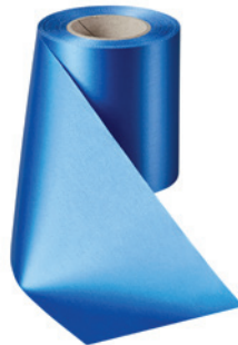
Art.-Nr.: 06000 Farbe: 025 enzyanblau