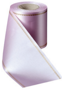
Art.-Nr.: 06078 Farbe: 094 rosa