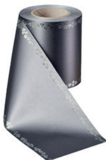
Art.-Nr.: 06737 Farbe: 023 anthrazit