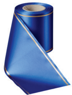
Art.-Nr.: 06508 Farbe: 025 enzianblau