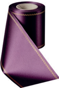
Art.-Nr.: 06078 Farbe: 037 pflaume