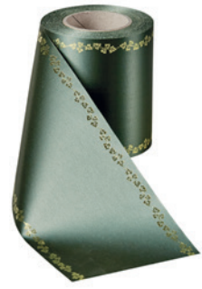
Art.-Nr.: 06738 Farbe: 027 flaschengrün