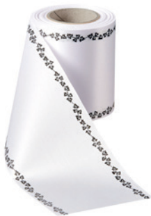
Art.-Nr.: 06739 Farbe: 001 weiß