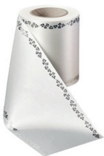
Art.-Nr.: 06737 Farbe: 001 weiß