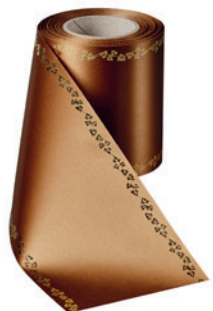
Art.-Nr.: 06738 Farbe: 064 braun