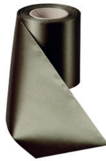
Art.-Nr.: 06000 Farbe: 029 moosgrün