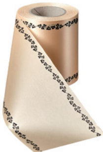
Art.-Nr.: 06739 Farbe: 075 beige