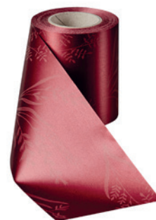
Art.-Nr.: 06890 Farbe: 019 kardinalrot