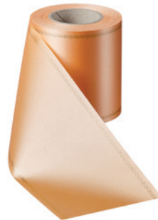
Art.-Nr.: 06078 Farbe: 073 pfirsich