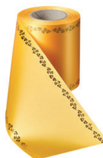
Art.-Nr.: 06738 Farbe: 053 freesia