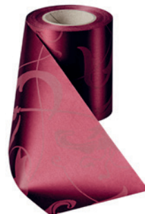
Art.-Nr.: 06860 Farbe: 019 kardinalrot