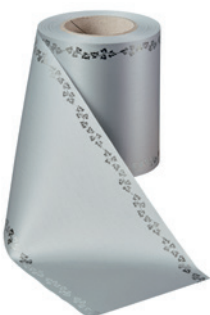
Art.-Nr.: 06737 Farbe: 022 hellgrau