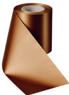
Art.-Nr.: 06000 Farbe: 064 braun