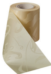
Art.-Nr.: 06860 Farbe: 015 sekt