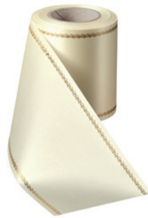
Art.-Nr.: 06078 Farbe: 003 natur