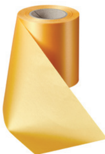
Art.-Nr.: 06000 Farbe: 053 freesia