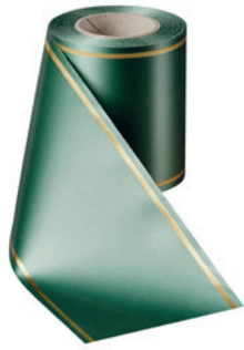
Art.-Nr.: 06508 Farbe: 020 grasgrün