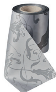
Art.-Nr.: 06860 Farbe: 022 hellgrau