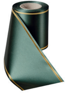
Art.-Nr.: 06508 Farbe: 027 flaschengrün