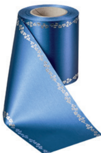
Art.-Nr.: 06737 Farbe: 025 enzianblau