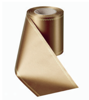
Art.-Nr.: 06078 Farbe: 064 braun