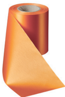
Art.-Nr.: 06000 Farbe: 086 terrakotta